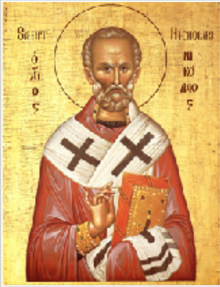
ST. NICHOLAS THE WONDERWORKER СВ. МИКОЛАЯ ЧУДОТВОРЦЯ